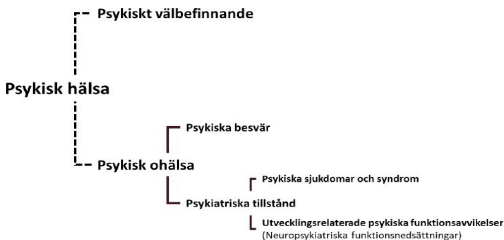
Bild 1: Modell som beskriver hur begrepp inom området psykisk hälsa förhåller sig till varandra. 5

Sambanden mellan psykisk ohälsa och självmord är tydliga och psykiatriska tillstånd innebär en ökad risk för suicid. Trots detta har långt ifrån alla som försöker ta sitt liv eller som dör i suicid haft kontakt med vården.