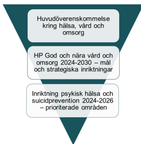
Bild 2. Kopplingen mellan Handlingsplan god och nära vård och omsorg (HÖK) och Inriktning för psykisk hälsa och suicidprevention.

Det länsgemensamma arbetet för psykisk hälsa och suicidprevention är en del i arbetet för god och nära vård och omsorg. Huvudöverenskommelsens övergripande målområden och Handlingsplan för god och nära vård och omsorg 2024 – 2030 är genom sina strategiska inriktningar styrande i detta arbete.