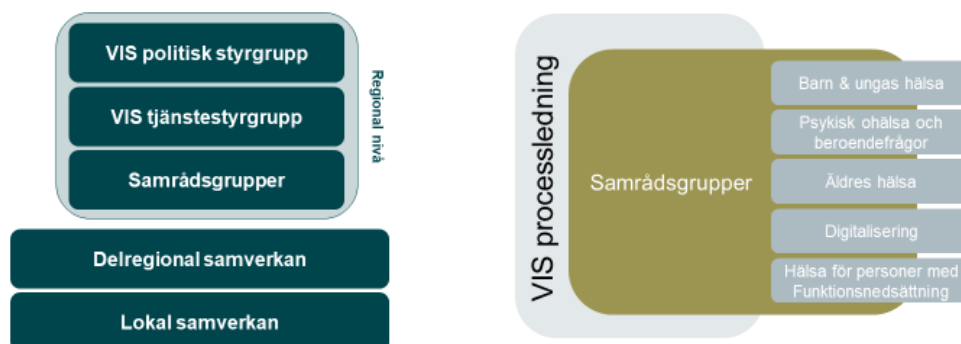
Figur: Schematisk bild över samverkansorganisationen

En tydlig ansvarsfördelning i kommunikationsarbetet behövs för att det inte ska råda någon tvekan om vem som ansvarar för att insatser planeras, godkänns, genomförs och följs upp. Oavsett vilken roll man har i samverkansorganisationen ansvarar var och en i stor utsträckning för att ställa samman, förmedla och följa upp sin kommunikation. Det ger ett delat ansvar för att allt som kommuniceras ska utgöra ett betydande bidrag till att nå målen för samverkan.